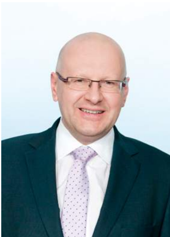
Генеральный директор группы компаний BWT Андреас Вассенбахер